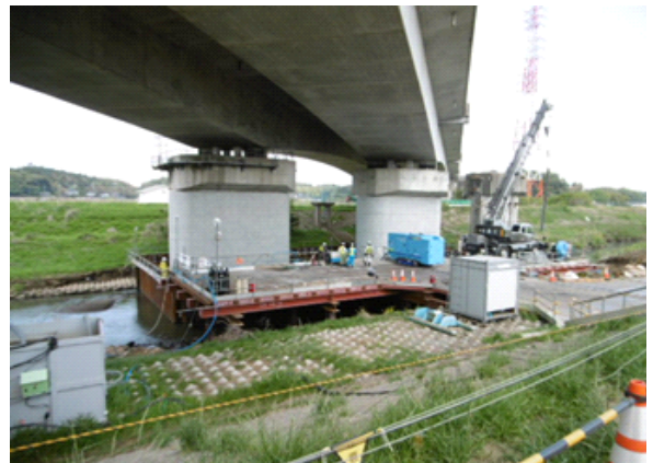
根木名川橋りょう橋脚耐震補強工事(河川内)