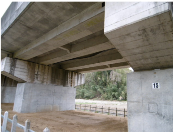
曲田高架橋柱耐震補強工事