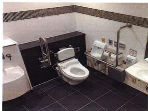
多機能トイレイメージ