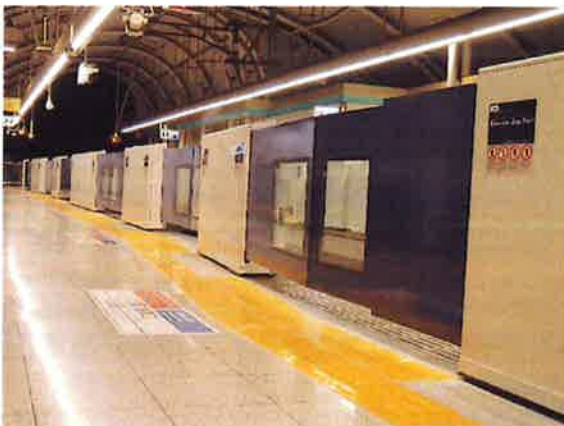
ホームドアイメージ（写真は日暮里駅）