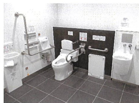
多機能トイレ内観