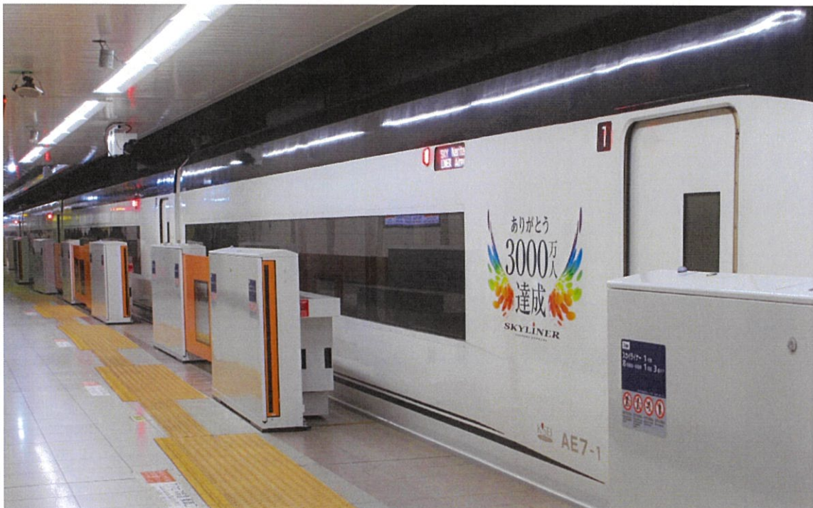
空港第2ビル駅ホームドア