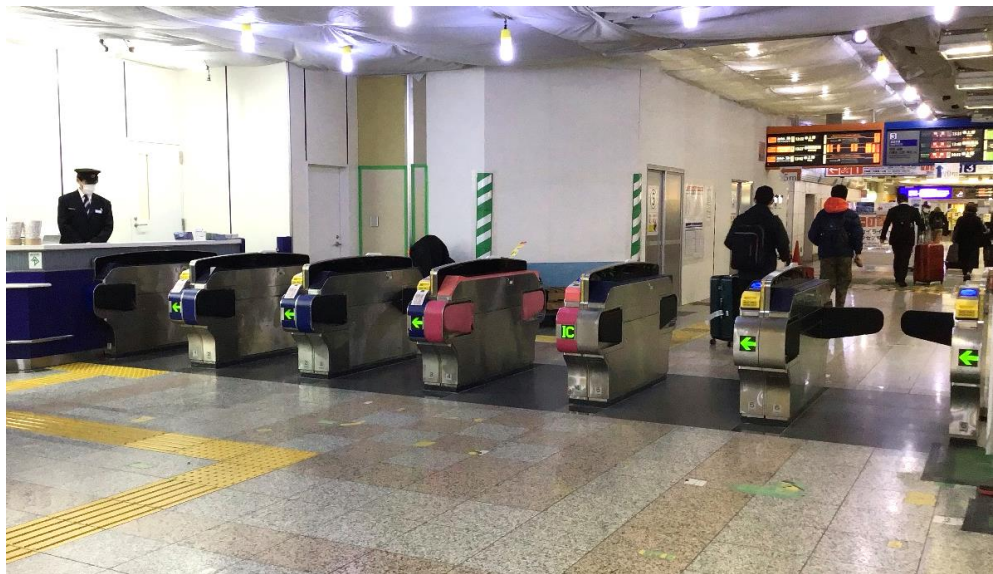
空港第2ビル駅 入口改札