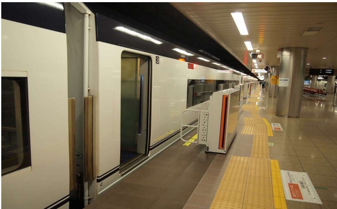
成田空港駅ホームドア