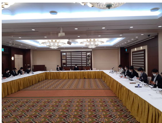
令和5年3月保守連絡会議