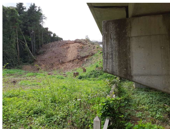
沿線近接樹木伐採工事