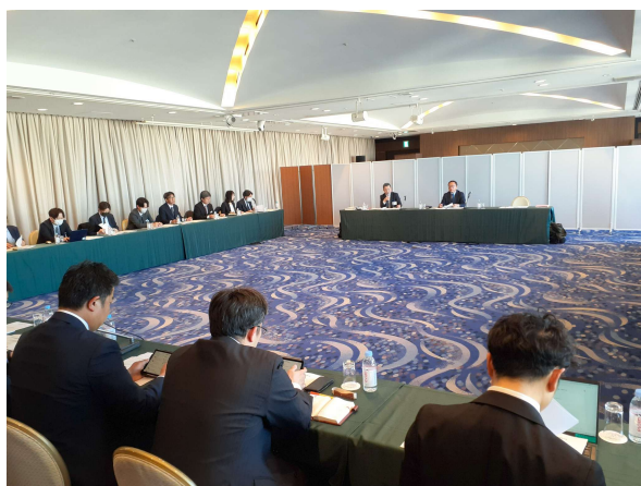
令和8年3月保守連絡会議