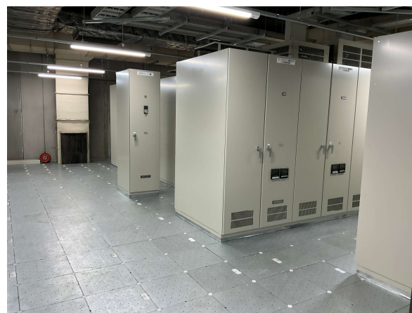
成田空港駅配電機器更新工事